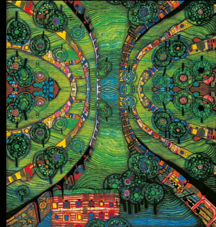
Eine Bearbeitung nach 781 GREEN TOWN • GRÜNE STADT • VILLE VERTE, 1978

AUSSTELLUNG IM RESIDENZSCHLOSS LUDWIGSBURG 11.03. - 25.06.2023