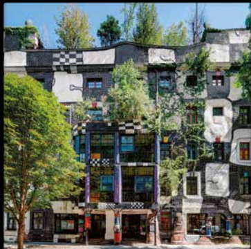
KUNSTHAUSWIEN, Österreich (Detail)