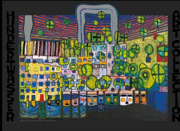
839 LOEWENGASSE - LA TROISIEME PEAU · DIE DRITTE HAUT, 1971

Hundertwasser Kunstdrucke wurden von Fall zu Fall von Originalwerken ausgehend weiterbearbeitet. Hundertwasser wusste, dass die Malerei ein anderes Medium ist als die Drucktechnik. Hundertwasser hat daher nie den Versuch unternommen, ein Bild in einen Druck umzuwandeln, sondern sah das Bild als Ausgangspunkt für ein neues Werk im Druckverfahren. Er hat die Vorteile und Möglichkeiten des Druckens auf Papier wahrgenommen und mit Hilfe ausgefeilter Drucktechniken das Werk weiterentwickelt, verändert und gestaltet, wodurch ein neues Werk entstand.