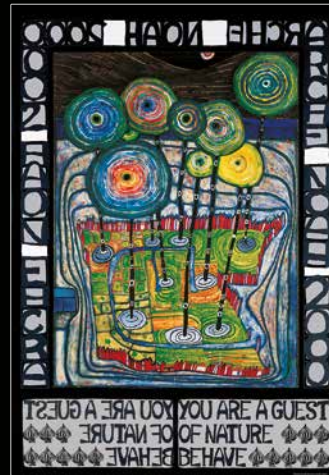
775A ARCHE NOAH 2000, Originalposter, 1981

Hundertwasser Kunstdrucke wurden von Fall zu Fall von Originalwerken ausgehend weiterbearbeitet. Hundertwasser wusste, dass die Malerei ein anderes Medium ist als die Drucktechnik. Hundertwasser hat daher nie den Versuch unternommen, ein Bild in einen Druck umzuwandeln, sondern sah das Bild als Ausgangspunkt für ein neues Werk im Druckverfahren. Er hat die Vorteile und Möglichkeiten des Druckens auf Papier wahrgenommen und mit Hilfe ausgefeilter Drucktechniken das Werk weiterentwickelt, verändert und gestaltet, wodurch ein neues Werk entstand.