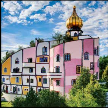
ROGNER BAD BLUMAU * Stammhaus, Steiermark, Österreich (Detail) • www.blumau.com

„Einen Baum schneidet man in 5 Minuten um. Zum Wachsen braucht er aber 50 Jahre. Das ist ungefähr das Verhältnis zwischen technokratischer Zerstörung und ökologischem Aufbau.“